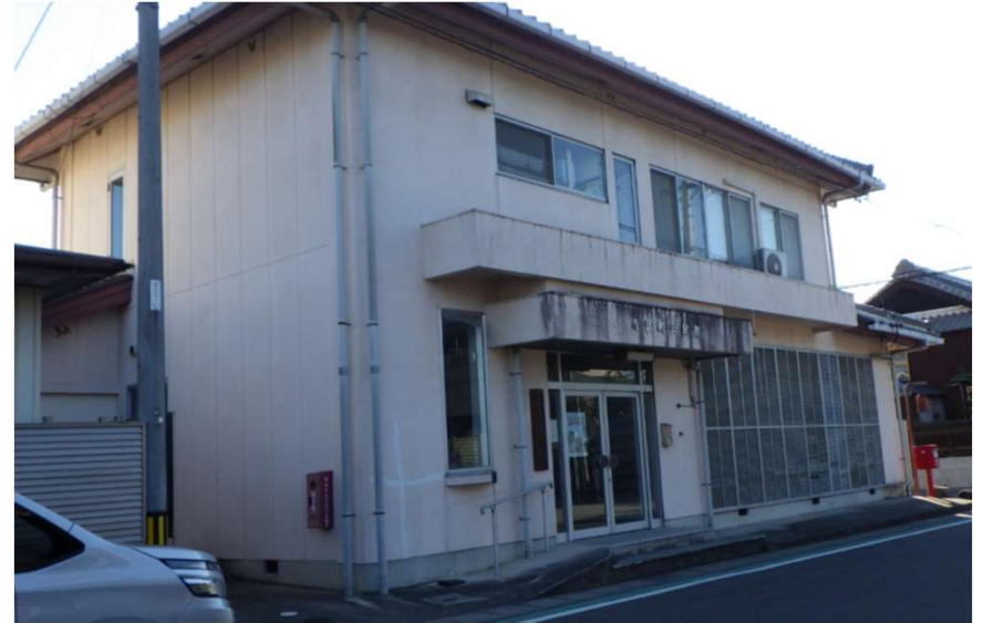
寺部公民館(全館使用)