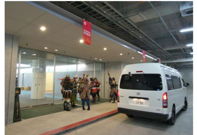
事務局の車輛にて移動