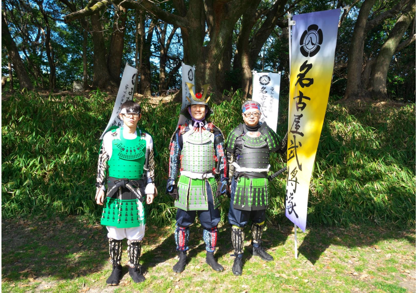
森松隊(名古屋武将隊)