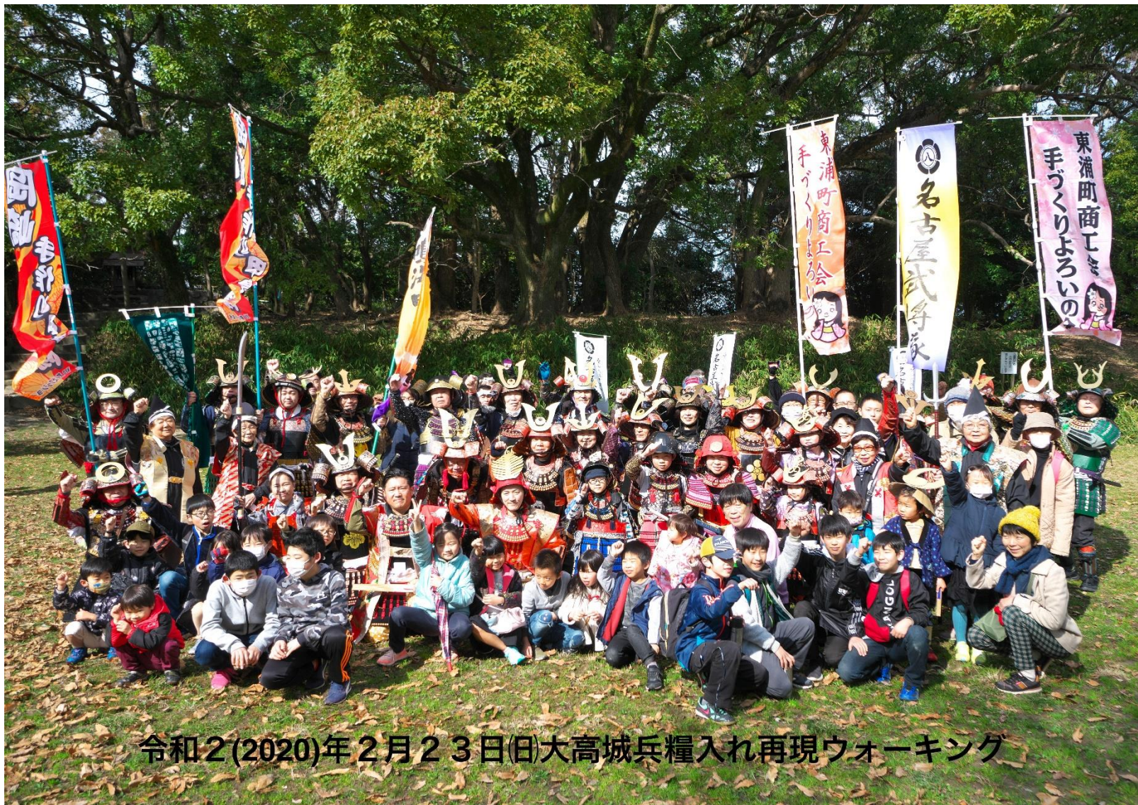
令和2(2020)年2月23日(日)大高城兵糧入れ再現ウォーキング