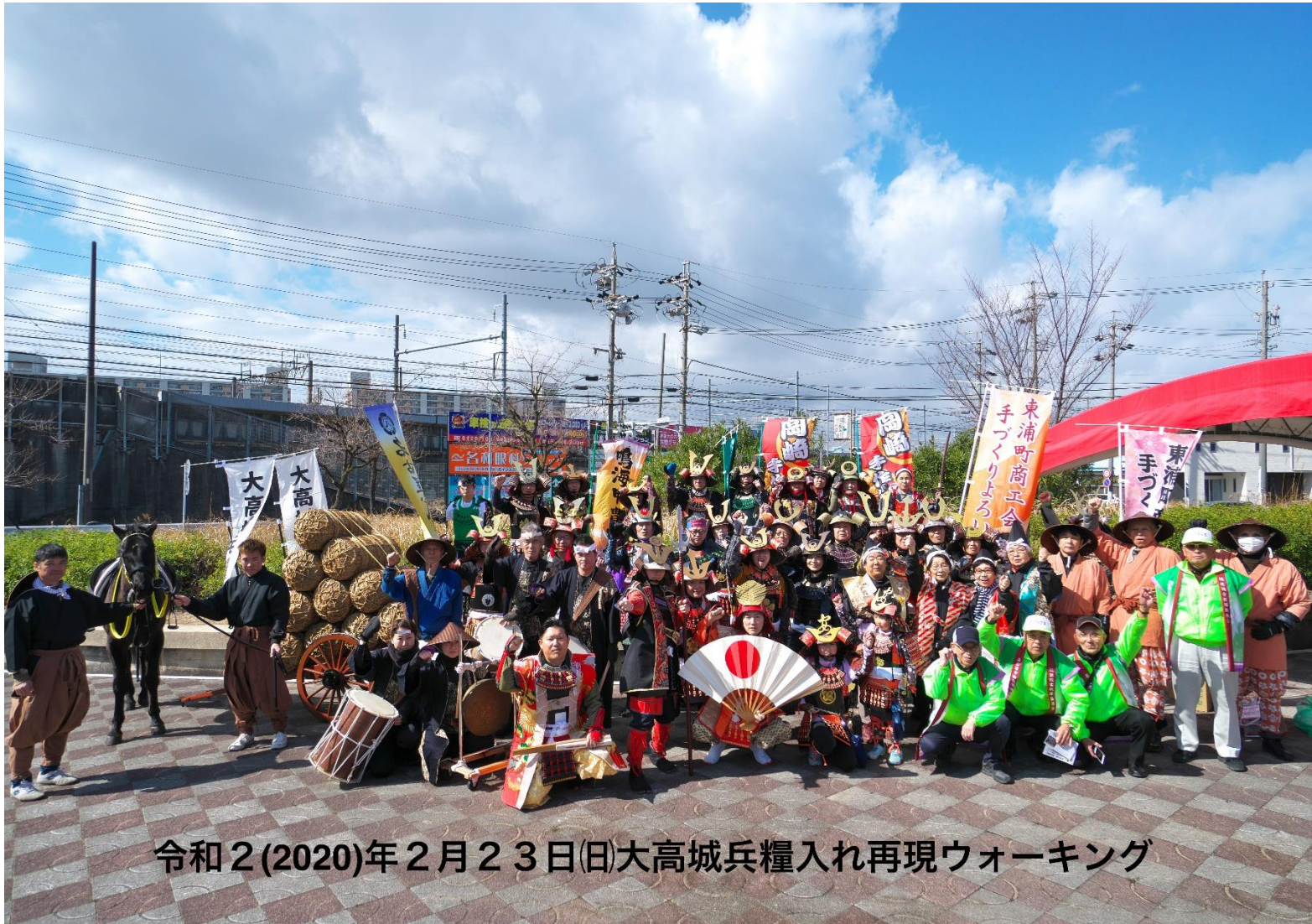
令和2(2020)年2月23日(日)大高城兵糧入れ再現ウォーキング