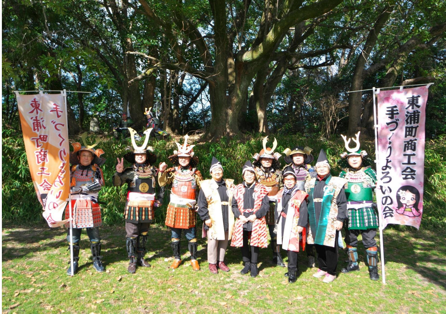
東浦町手づくりよろしの会