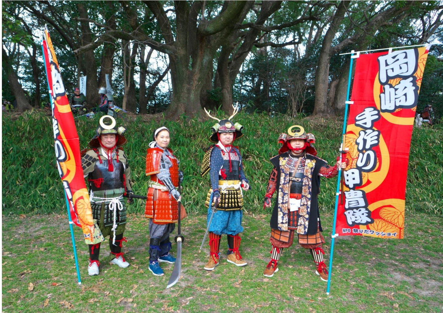
岡崎手作り甲冑隊