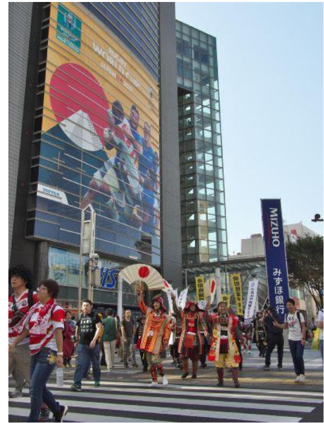
愛知戦国甲冑隊の出陣