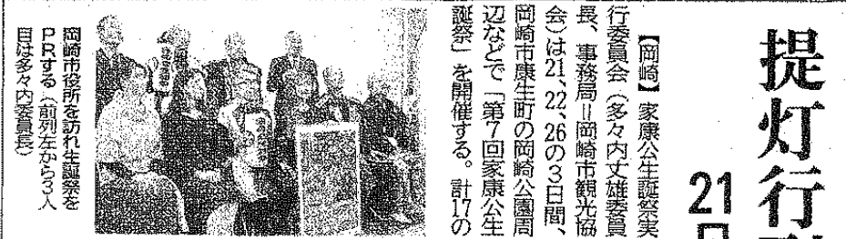
岡崎市役所を訪れ生誕祭をPRする(前列左から3人目は多々内委員長)