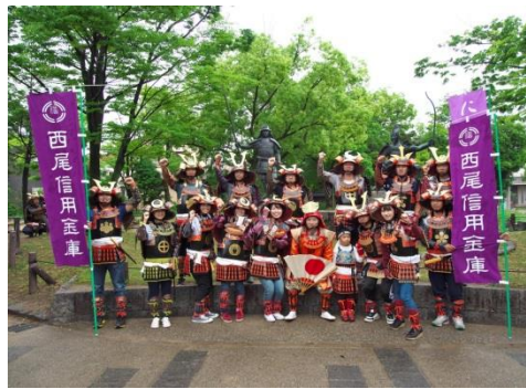
西尾信用金庫武将隊