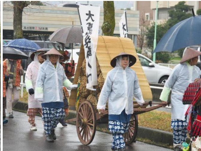
雨中の住宅地内の練り歩き