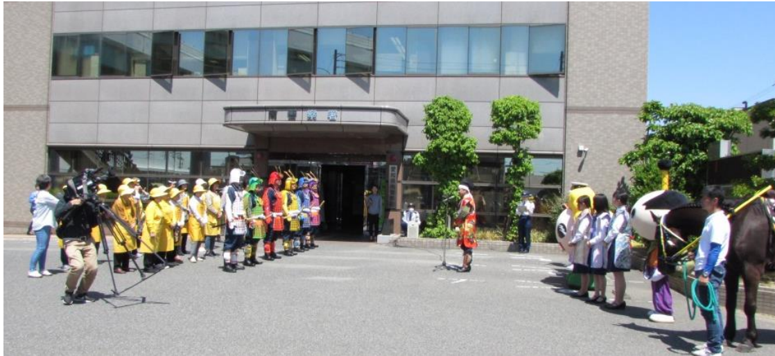
南警察署前での出陣式