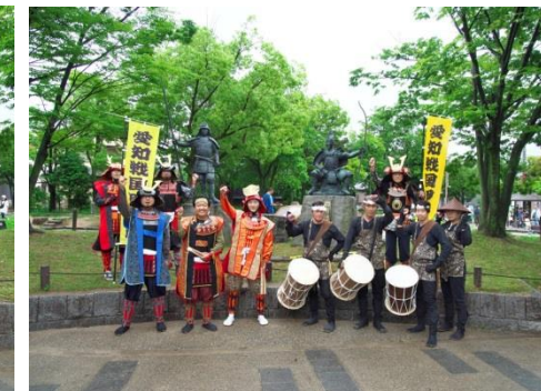
機動隊・鯨龍太鼓隊