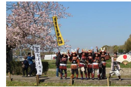
なかむら隊・南隊・田角隊