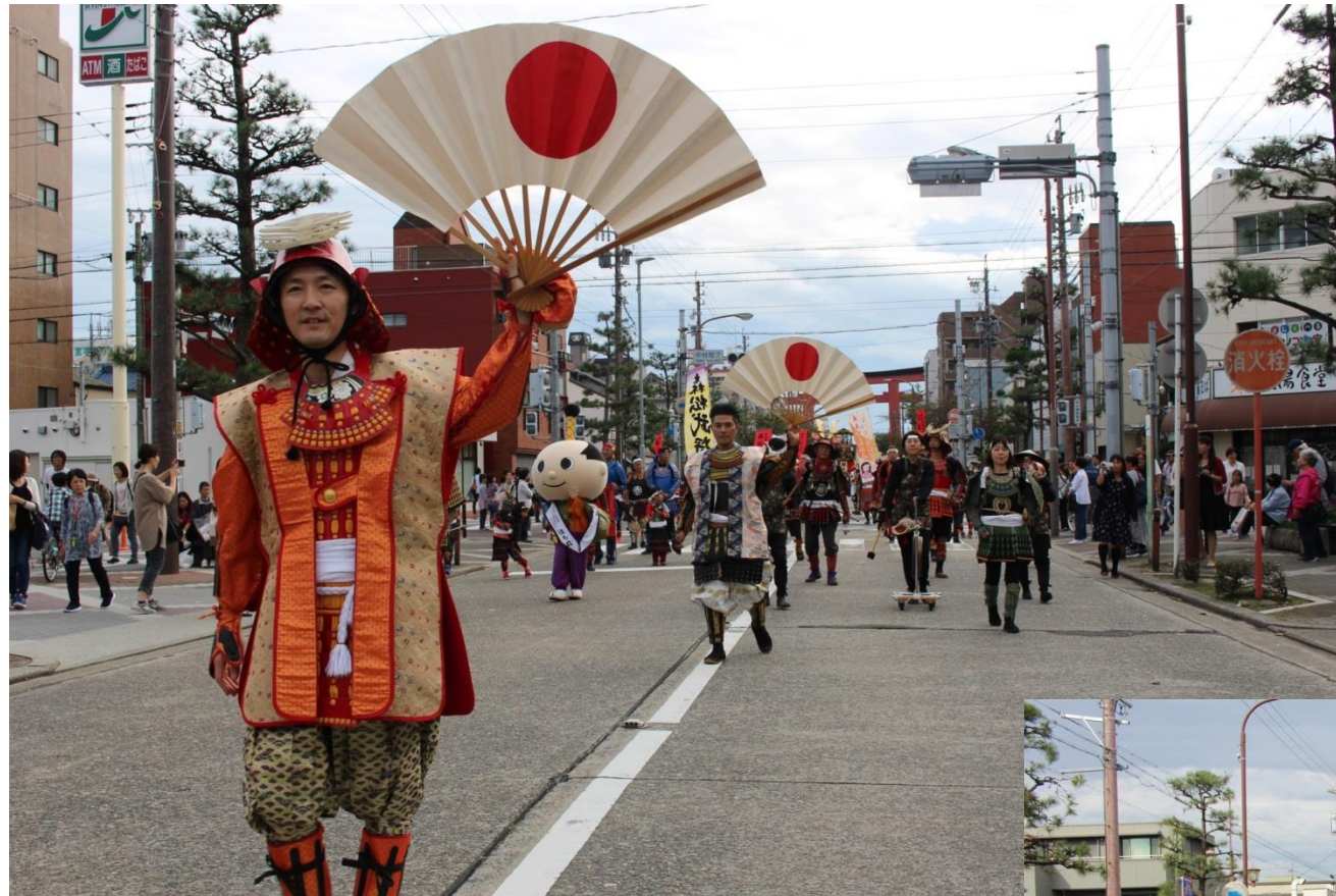
近藤元帥総大将を筆頭に道路一杯にパレードを行った