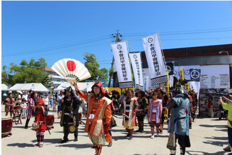
黒田小学校会場へ入城