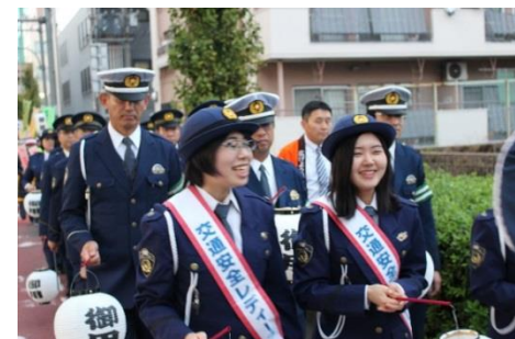
各隊ごとに パレードを 行った