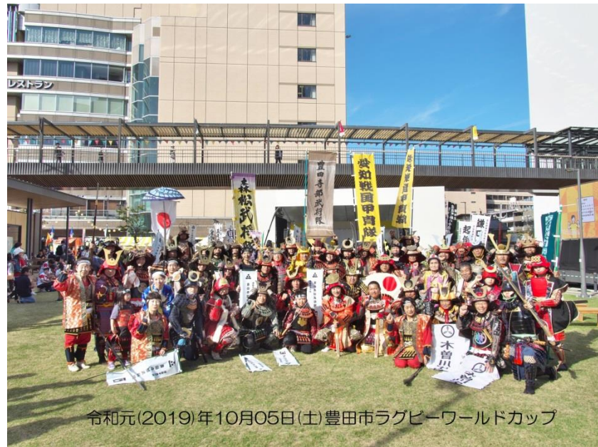
令和元(2019)年10月05日(土)豊田市ラグビーワールドカップ