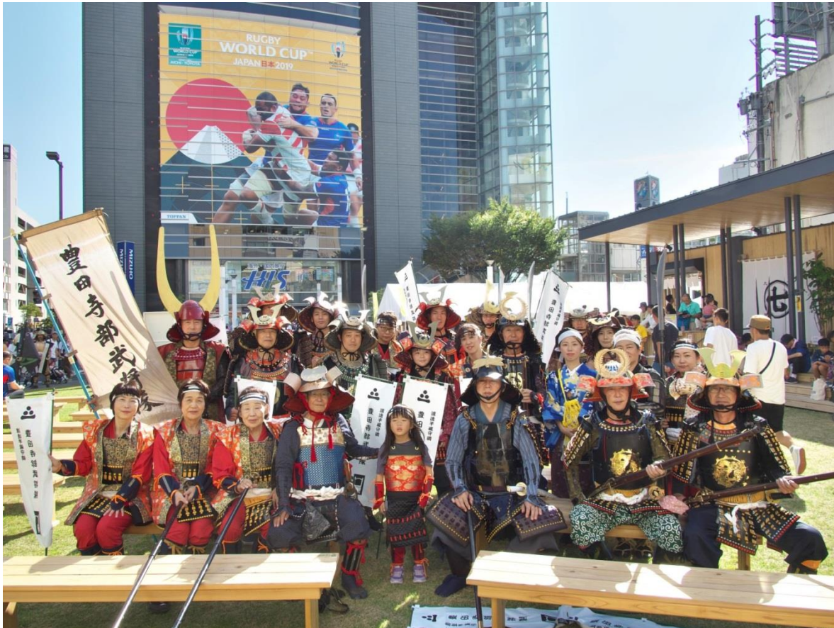
主力組の豊田寺部武将隊の揃い踏み