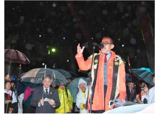
多々内実行委員長挨拶 (岡崎甲冑隊大将)