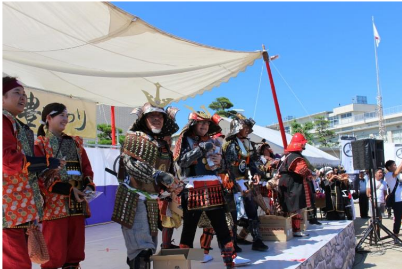
かりんとう投げと群がる来場者