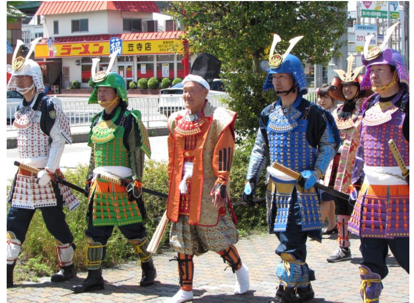
南警察署から南区役所までの練り歩き