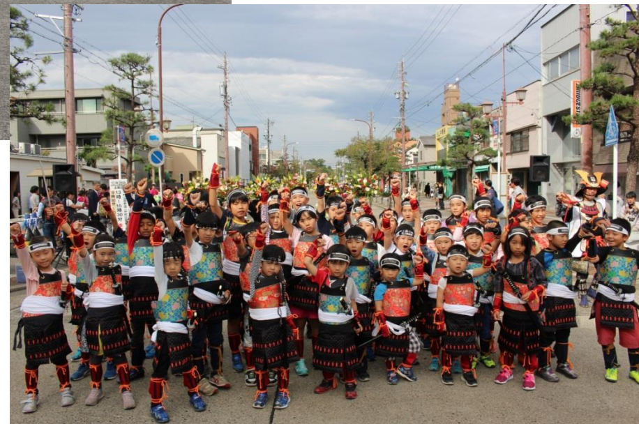
地元子ども甲冑隊の揃い踏み