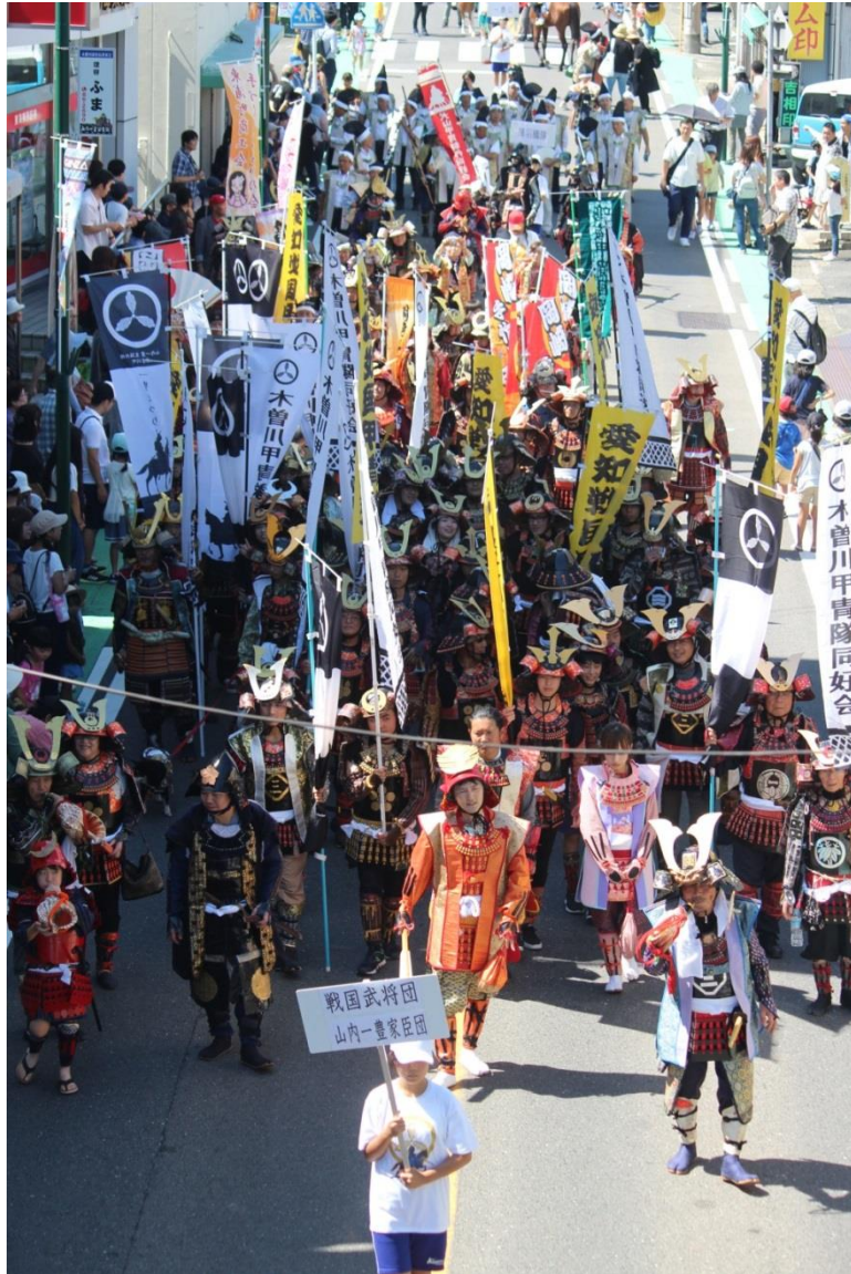
総勢450人の行列で商店街のパレードが行われた