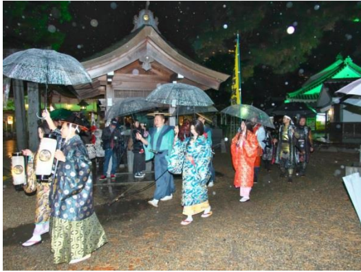
松平広忠公と於大の方一行の入城