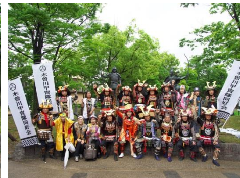
木曾川町甲冑同好会