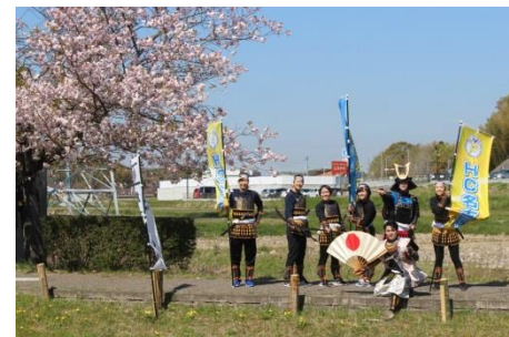
HC (ハンドボールクラブ) 名古屋隊