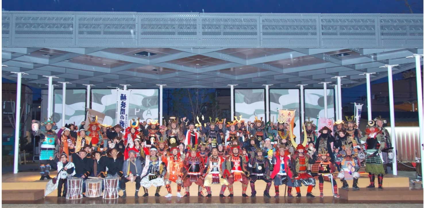
甲冑隊の揃い踏み