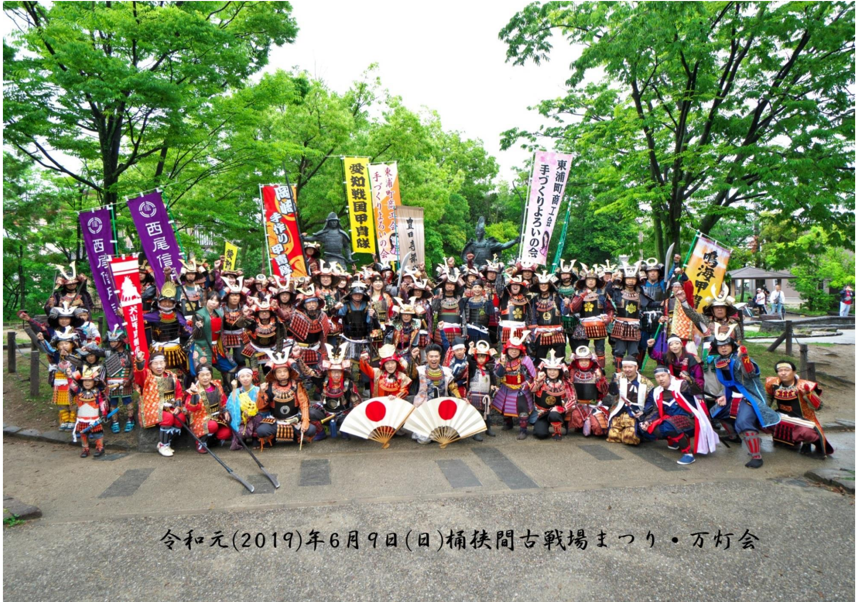
令和元(2019)年6月9日(日)桶狭間古戦場まつり・万灯会