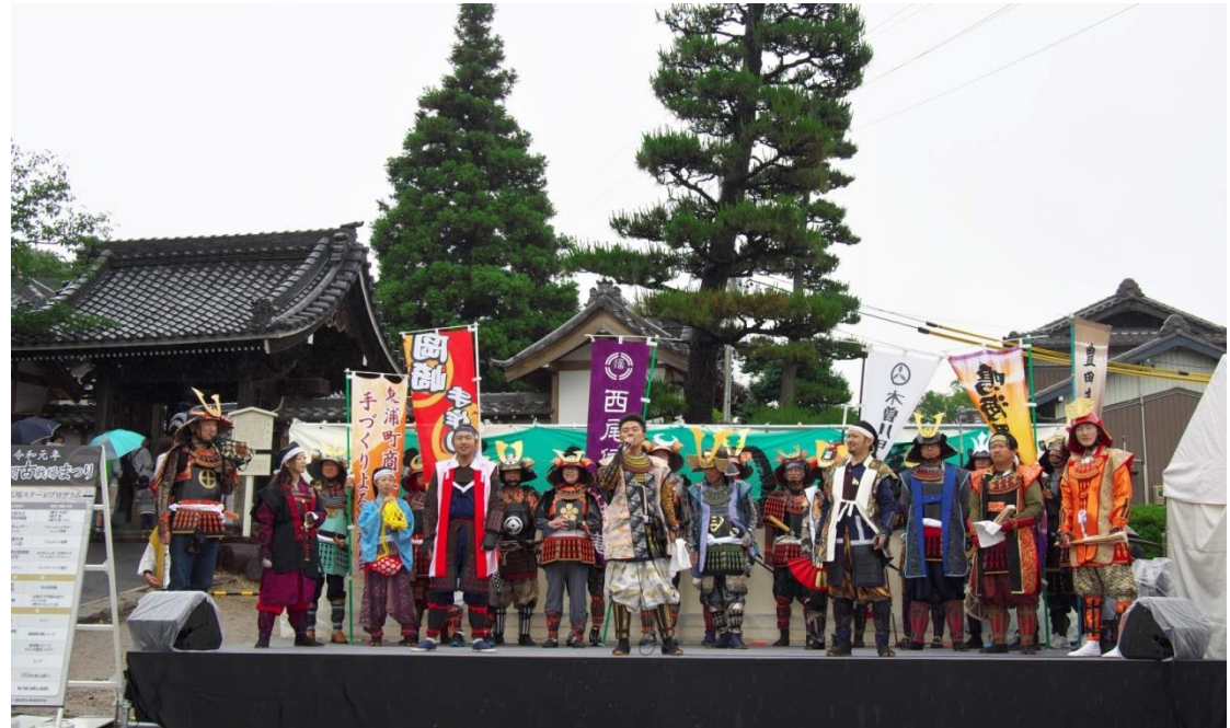
ステージには甲冑隊の代表が揃い踏みした