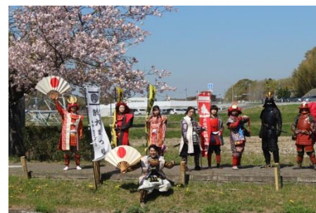
近藤総大将・七種援軍大将・機動隊・犬山隊