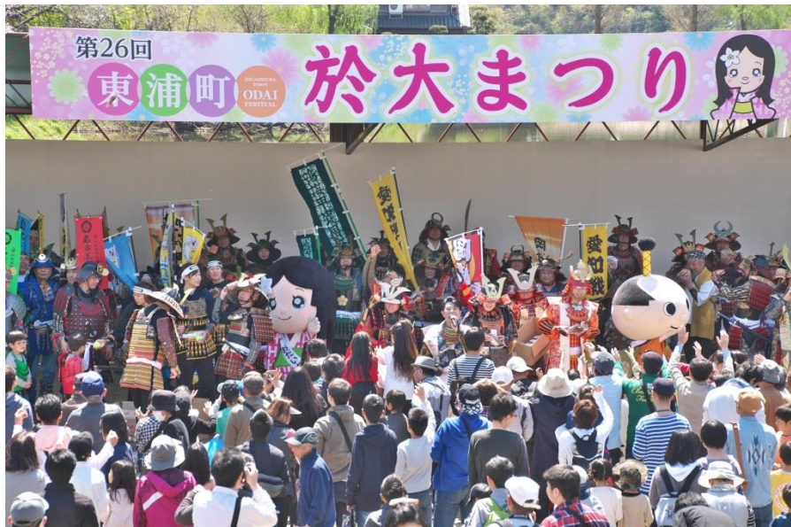
メインステージで盛り上がる「かりんとう投げ」

過去最多の200人の手作り武者行列が行われた 来場者も前夜祭で500人、本祭で5000人と 盛況となった（中部経済新聞）