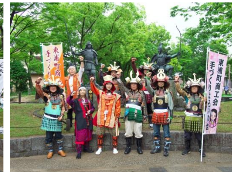
東浦町手づくりよろいの会