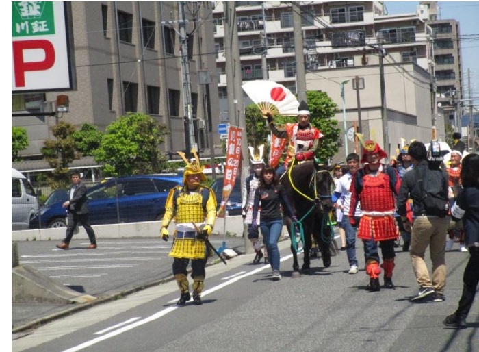
馬上の警察署長を先頭にパレード開始