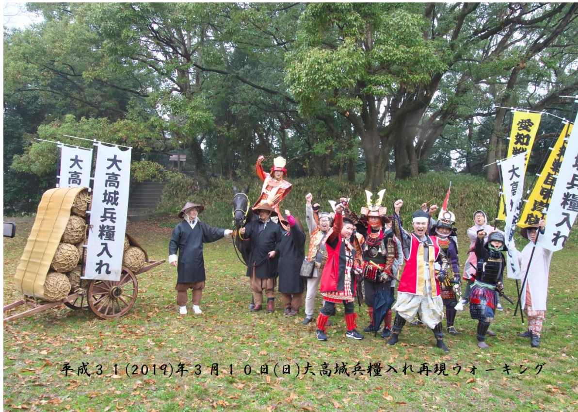
平成31(2019)年3月10日(日)大高城兵糧入れ再現ウォーキング