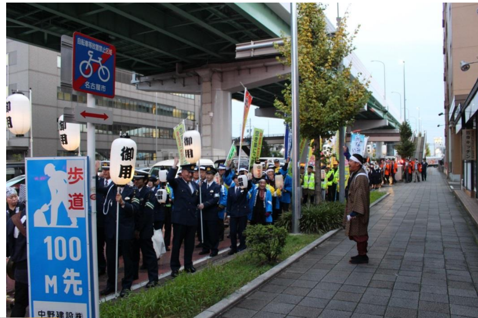
国道1号線で勝ち鬨をあげる