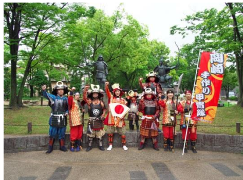
岡崎手作り甲冑隊