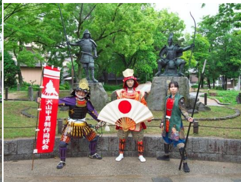
犬山甲冑制作同好会