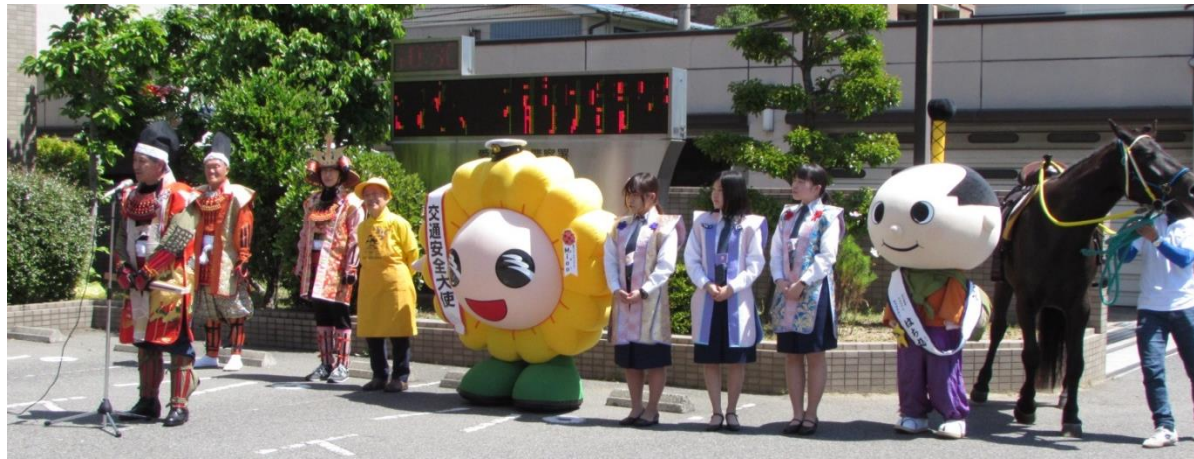
南警察署前での出陣式