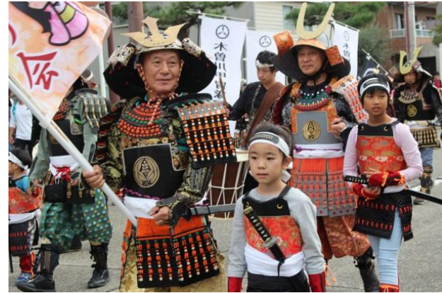
大人甲冑隊と子ども甲冑隊の1対1エスコートでパレードした