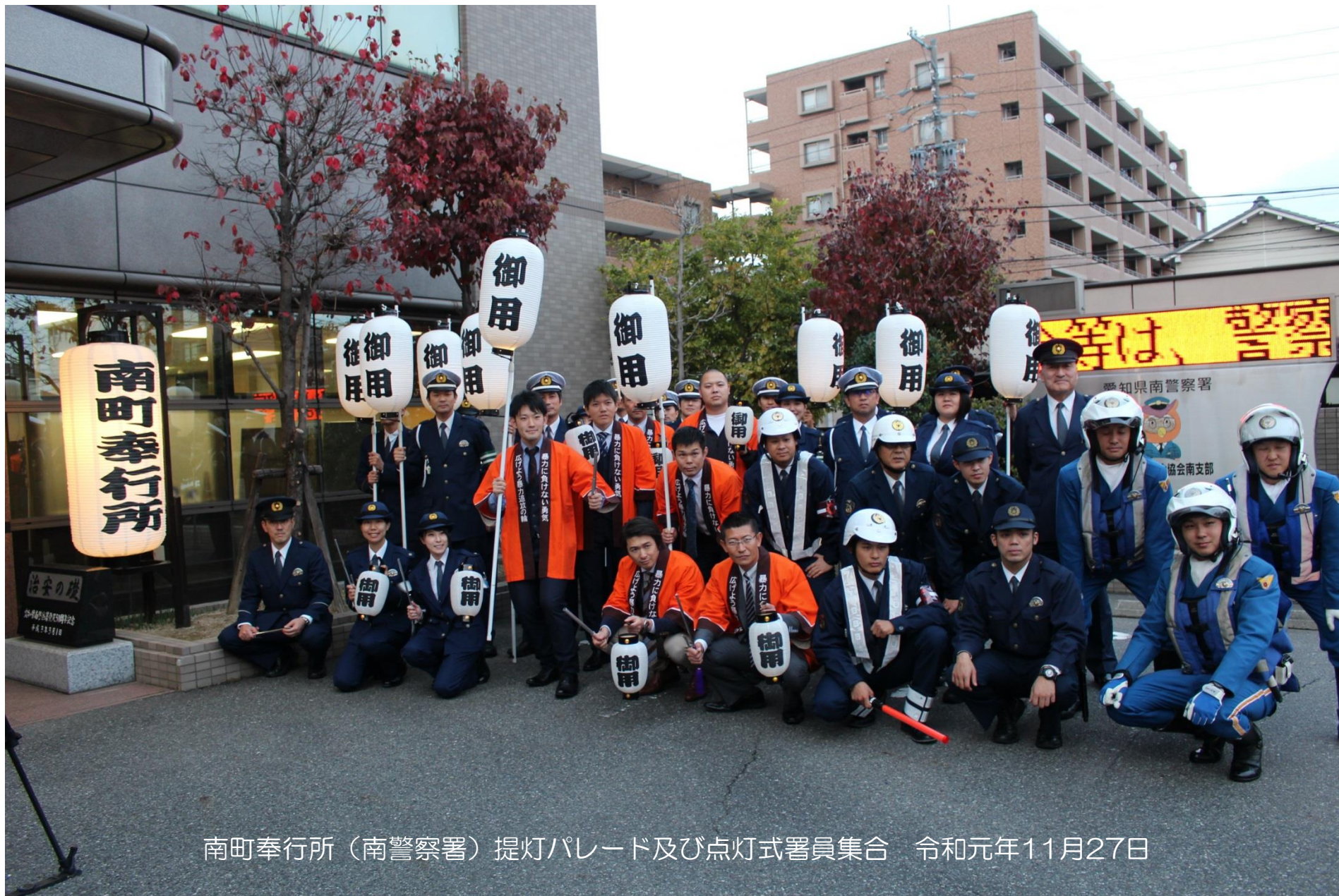
南町奉行所（南警察署）提灯パレード及び点灯式署員集合 令和元年11月27日