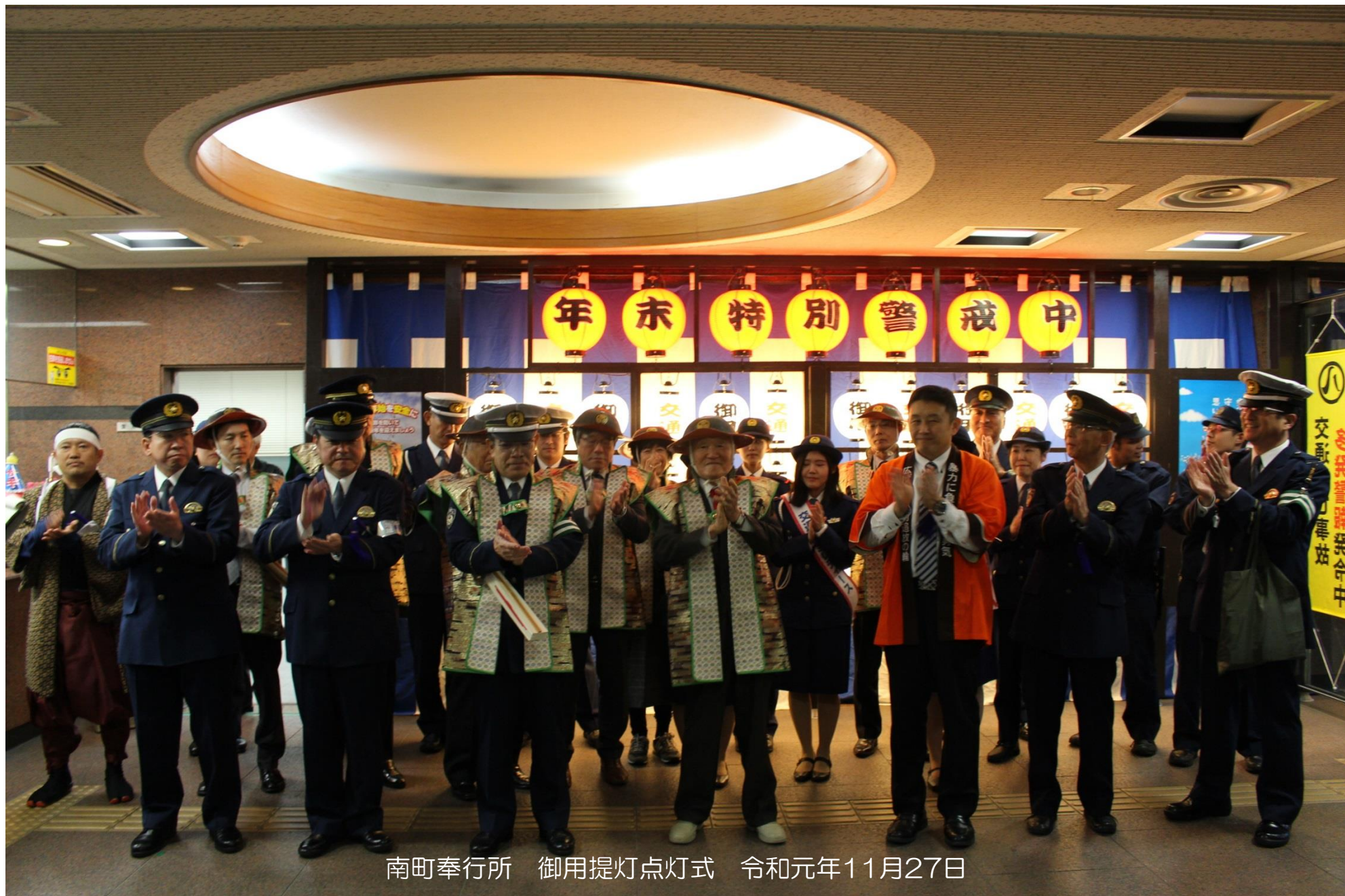
南町奉行所 御用提灯点灯式 令和元年11月27日