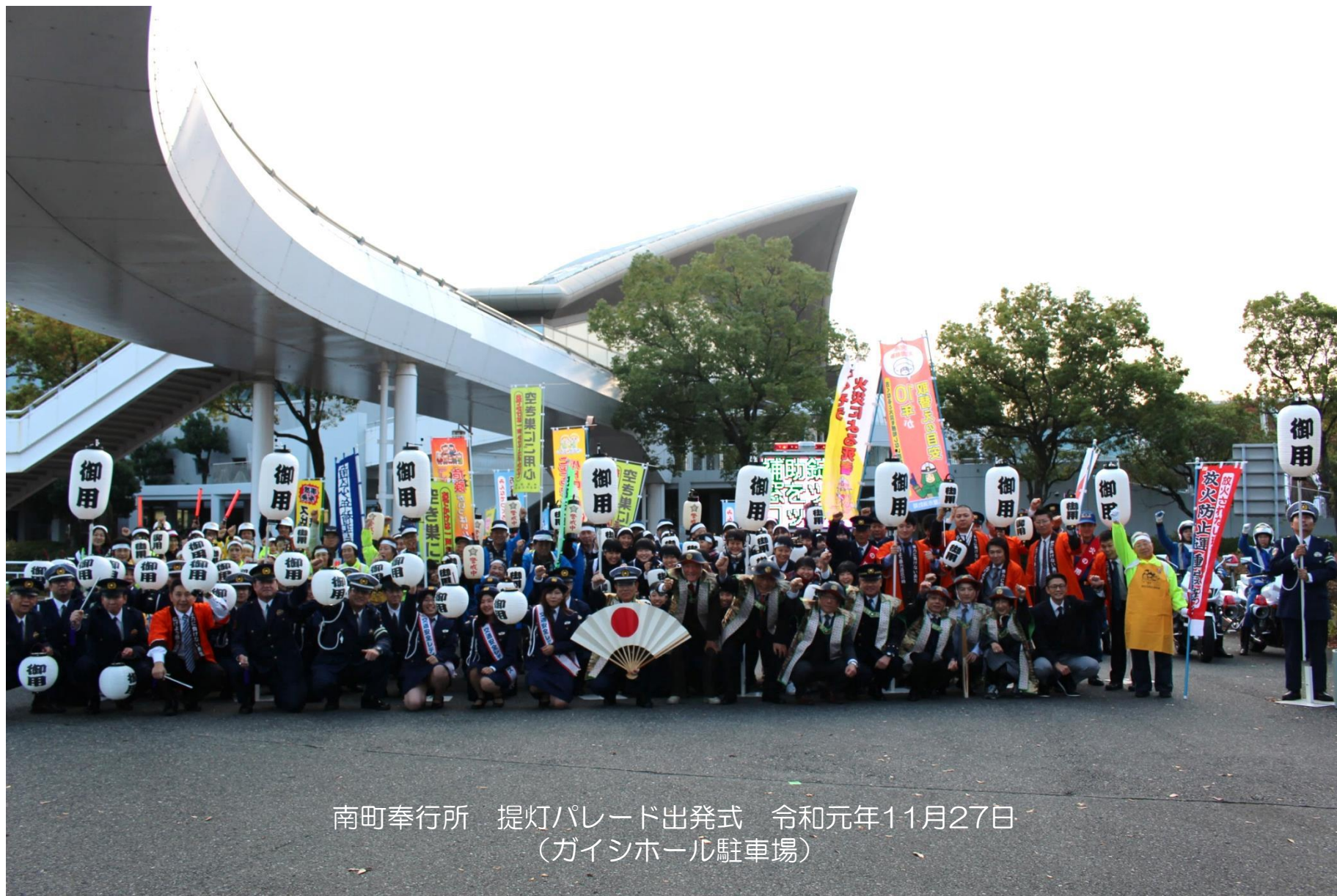
南町奉行所 提灯パレード出発式 令和元年11月27日 (ガイシホール駐車場)