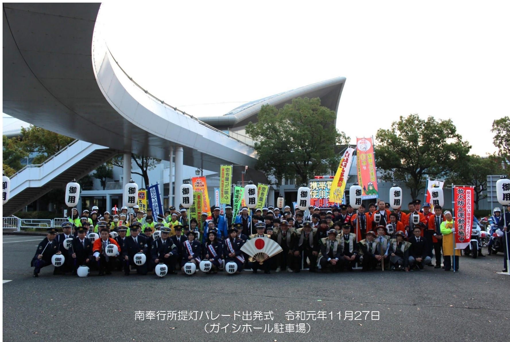
南奉行所提灯パレード出発式 令和元年11月27日 (ガイシホール駐車場)