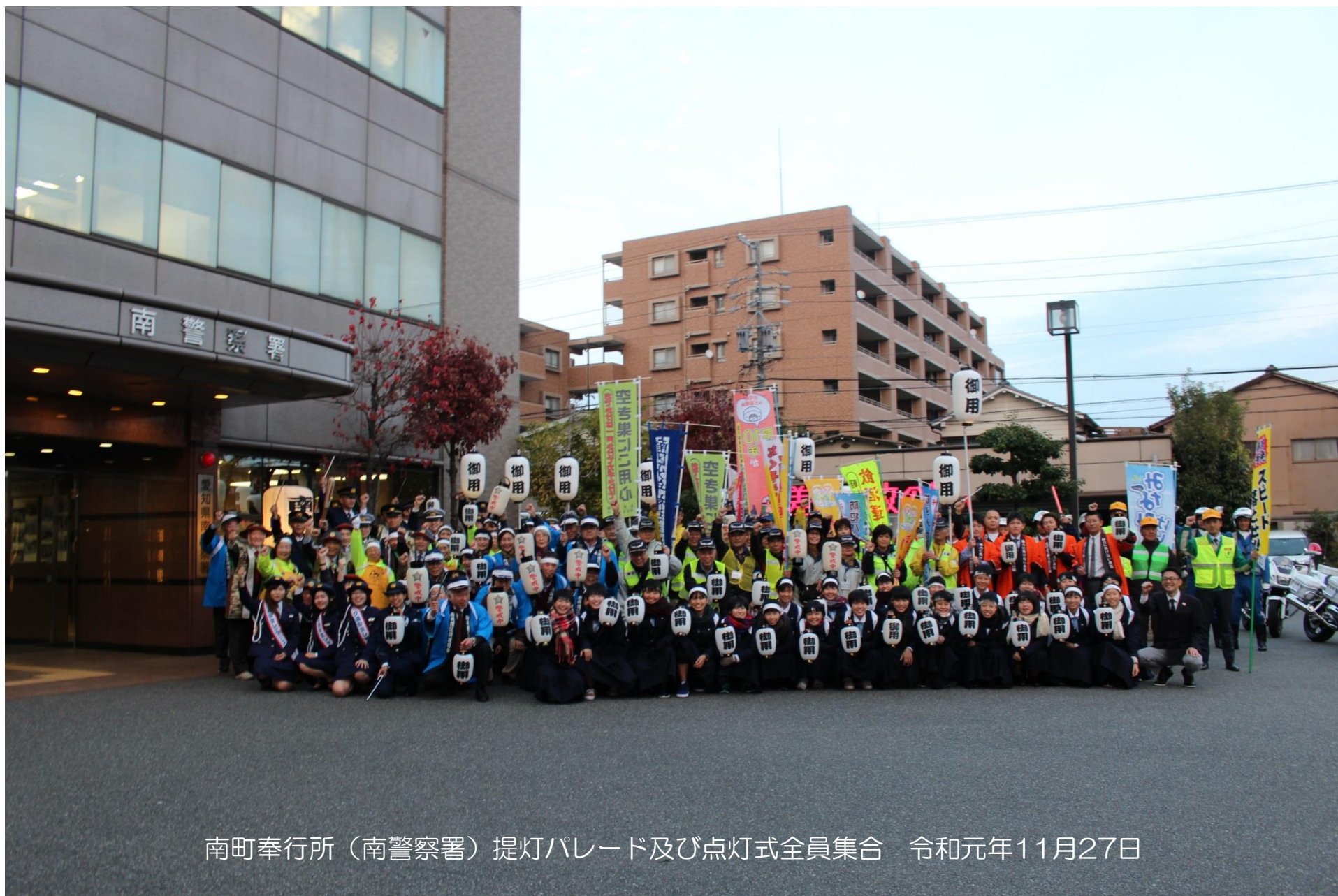
南町奉行所（南警察署）提灯パレード及び点灯式全員集合 令和元年11月27日