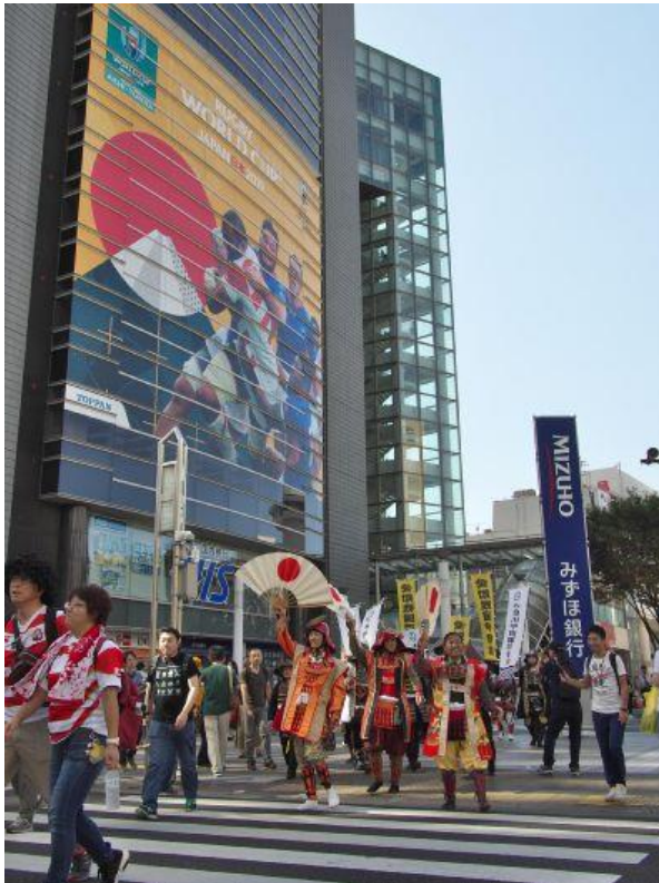
A 参合館前からのスタート