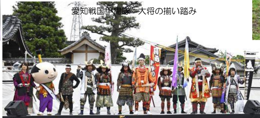
愛知戦国甲冑隊 大将の揃い踏み