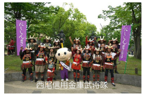
西尾信用金庫武将隊