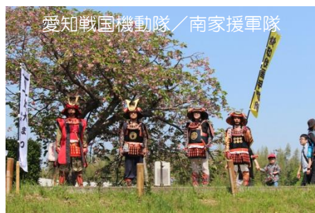
愛知戦国機動隊／南家援軍隊