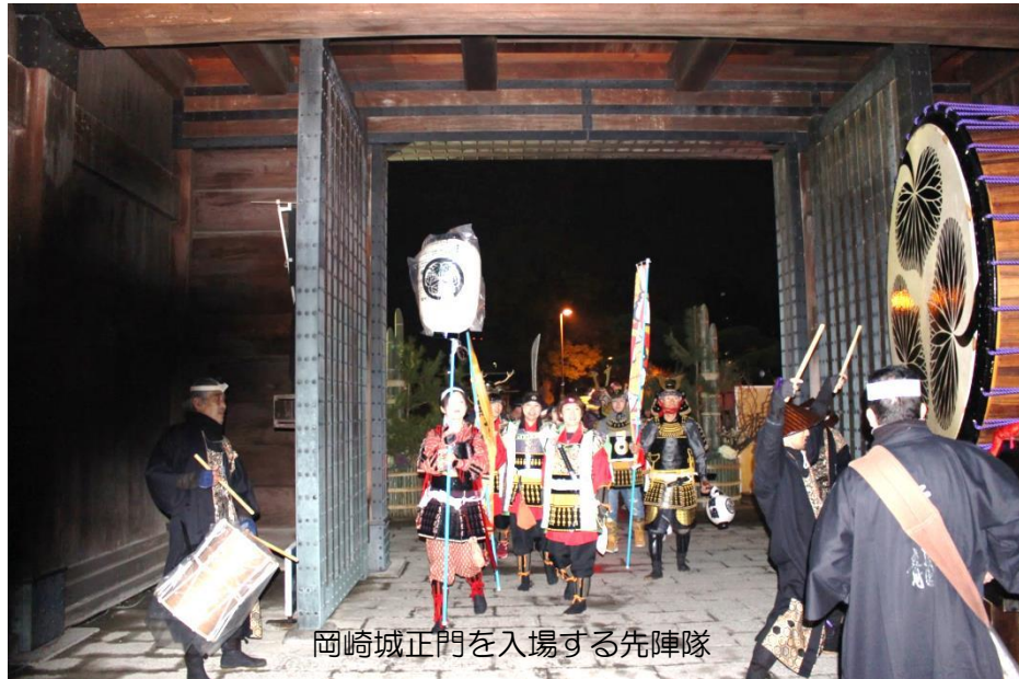
岡崎城正門を入場する先陣隊