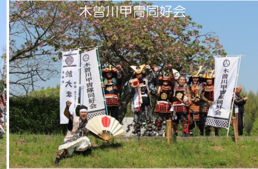
木曾川甲冑同好会