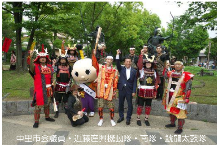
中里市議員・近藤産興機動隊・南隊・鯨龍太鼓隊