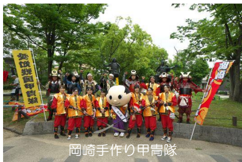
岡崎手作り甲冑隊