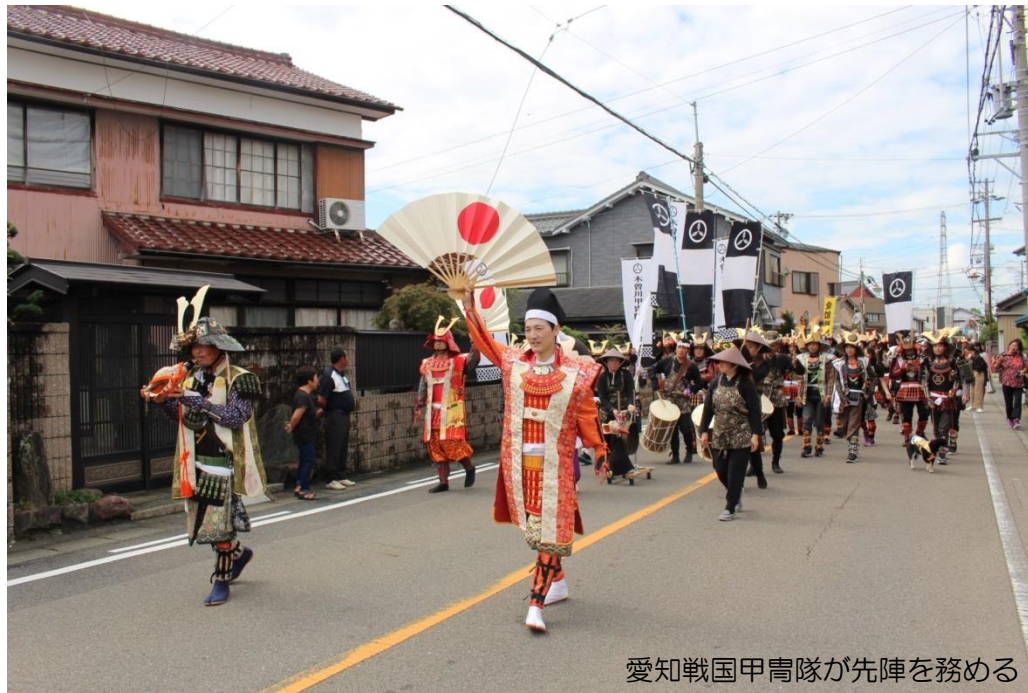
愛知戦国甲冑隊が先陣を務める