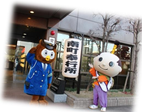
コノハ警部と はち丸くん

愛知県警南署は、署を江戸時代の奉行所に見立て、「南町奉行所」のちょうちん点灯式を行った。署員らは「御用」などと書かれたちょうちんと十手を力強く掲げ、忙しい年の瀬に向けて気合を入れた。