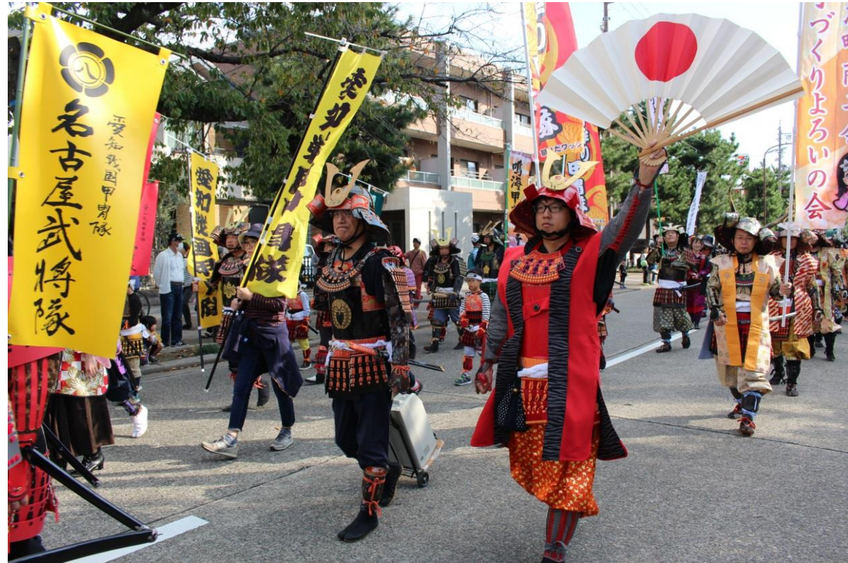
愛知戦国甲冑隊パレード