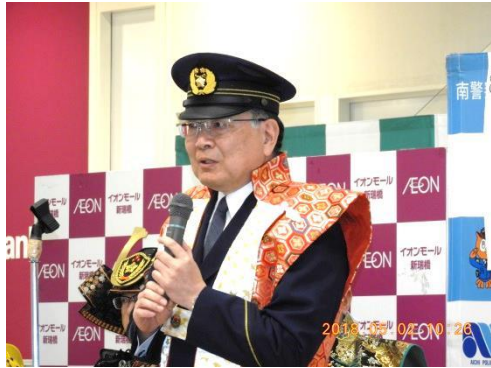
松永署長あいさつ

■甲冑姿で詐欺防止訴え 端午の節句を前に、南署の課長が2日、名古屋市南区菊住1丁目の「イオンモール新瑞橋」で、色とりどりの甲冑（かっちゅう）を身にまとい、交通安全と特殊詐欺の被害防止を訴えた。 4人の課長が赤、黄、青、白の甲冑を着て「甲冑隊」を結成。一日署長と副署長に任命された県警広報大使「BOYS AND MEN研究生」のかけ声にあわせ、「交通死亡事故を斬る」「特殊詐欺を斬る」と刀を振り下ろし、事故や被害防止を呼びかけた。 イベントでは、特殊詐欺の手口などを紹介するクイズも出題。松永署長は「交通事故も特殊詐欺も、自分のこととして考えてほしい」と話した。