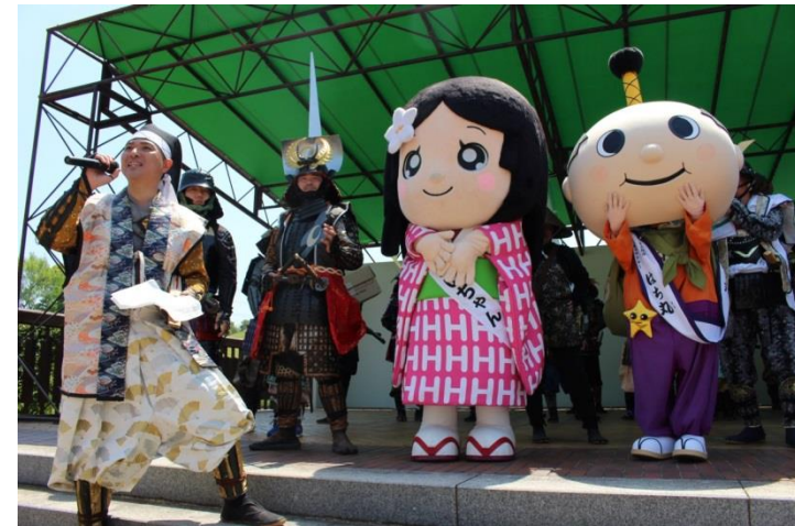
おだいちゃんと初登場のはち丸くん

行列は二十一日午前九時半、於大のみちの町中央図書館前をスタートし、公園までの約一・五キロを巡る。公園では新城市の長篠・設楽原鉄砲隊の火縄銃演武のほか、ステージイベントや物産展がある。(宮崎正嗣)