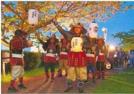
かちどきを上げながら散策路を歩く戦国武将行列―東浦町緒川で

また、名古屋市の観光キャラクター「はち丸くん」も市外へのイベントには初登場。おだいちゃんと共演した。