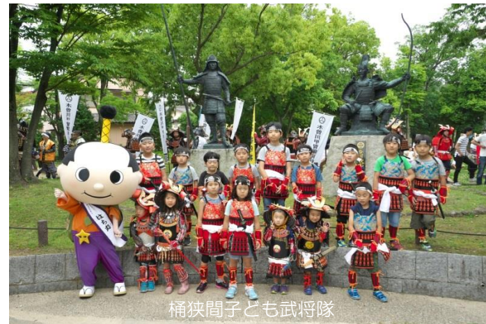
桶狭間子ども武将隊