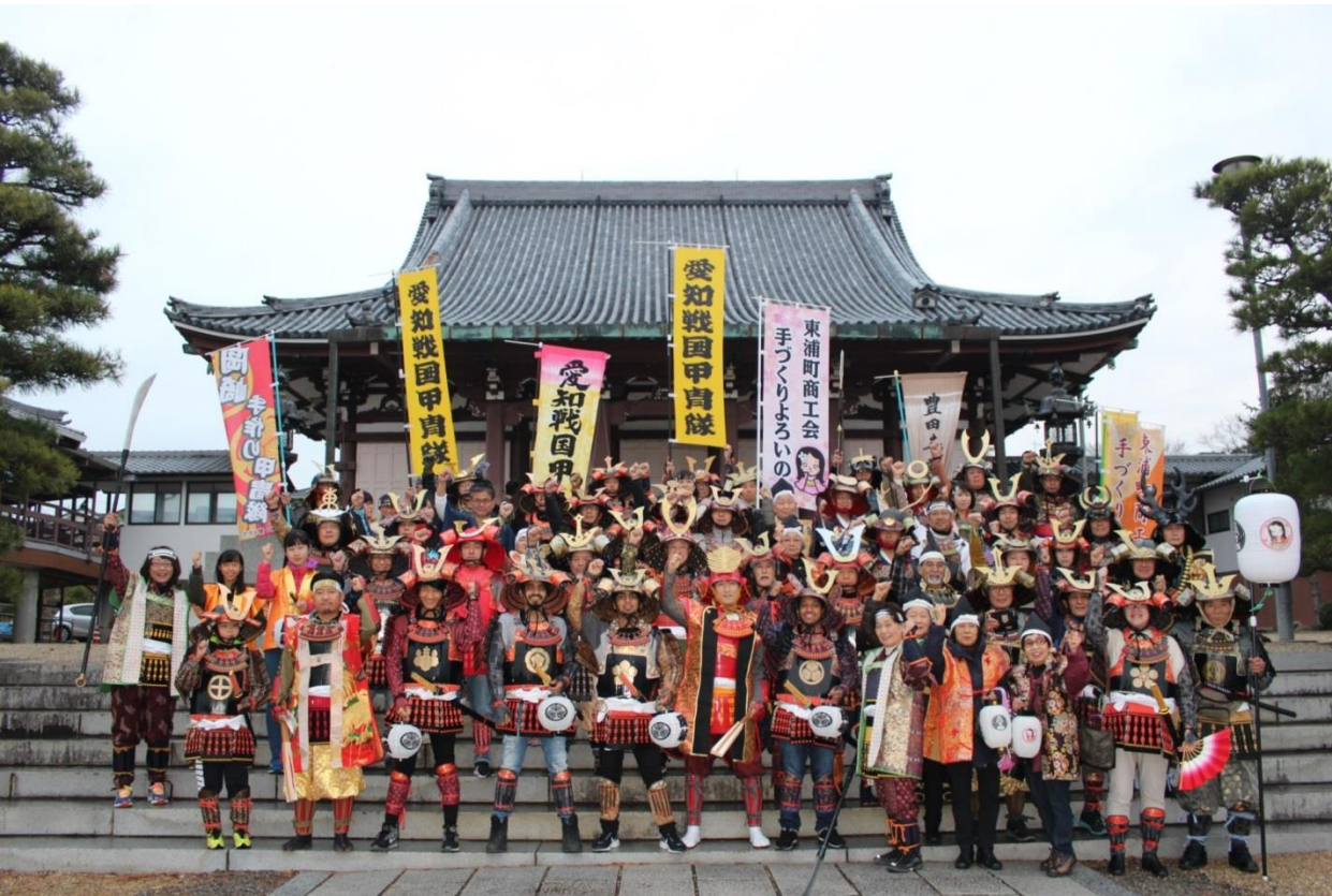
愛知戦国甲冑隊揃い踏み