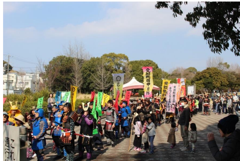
愛知戦国甲冑隊と一般参加者