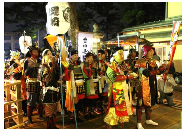
龍城神社にて愛知戦国甲冑隊の大安祈願