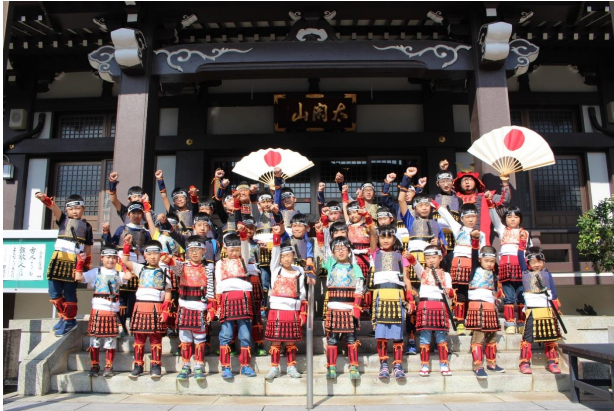
なかむら子ども甲冑隊揃い踏み