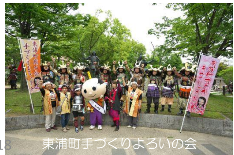
東浦町手づくりよろいの会