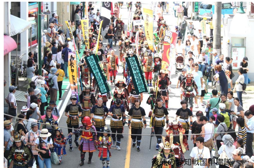
後陣の愛知戦国甲冑隊