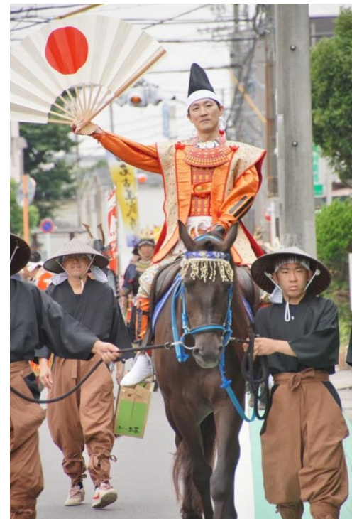
近藤元帥新総大将デビュー