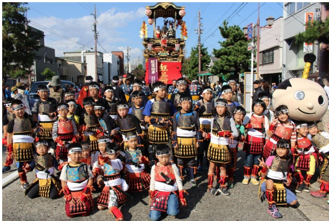
なかむら子ども武将隊とはち丸くん

甲冑隊の行列も恒例行事となっていており、地元の子どもの参加も増えてきている。今年も、子ども武将隊として40人の参加があり、大勢の親御さんも応援に駆け付けた。