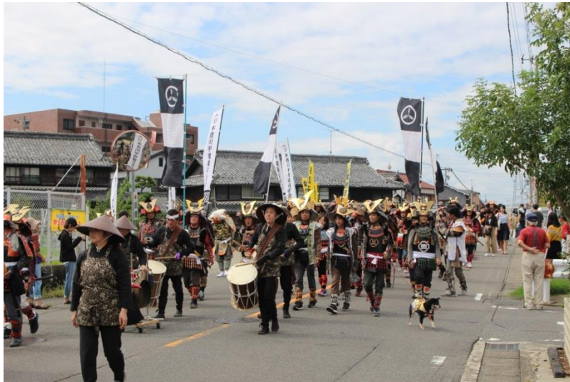
愛知戦国甲冑隊パレード