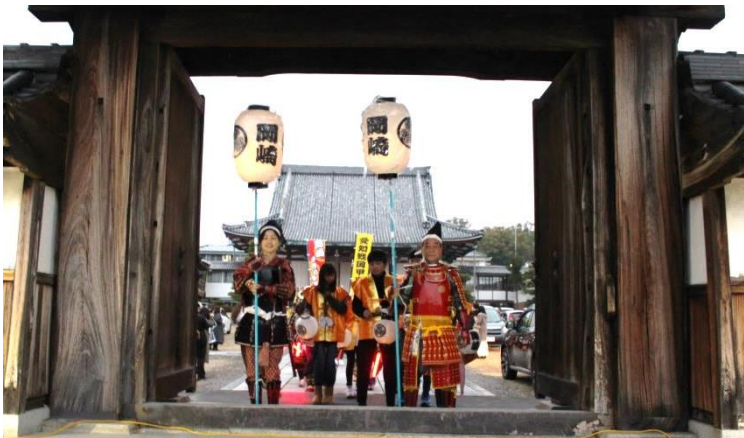
高張提灯隊先導で三河別院出発