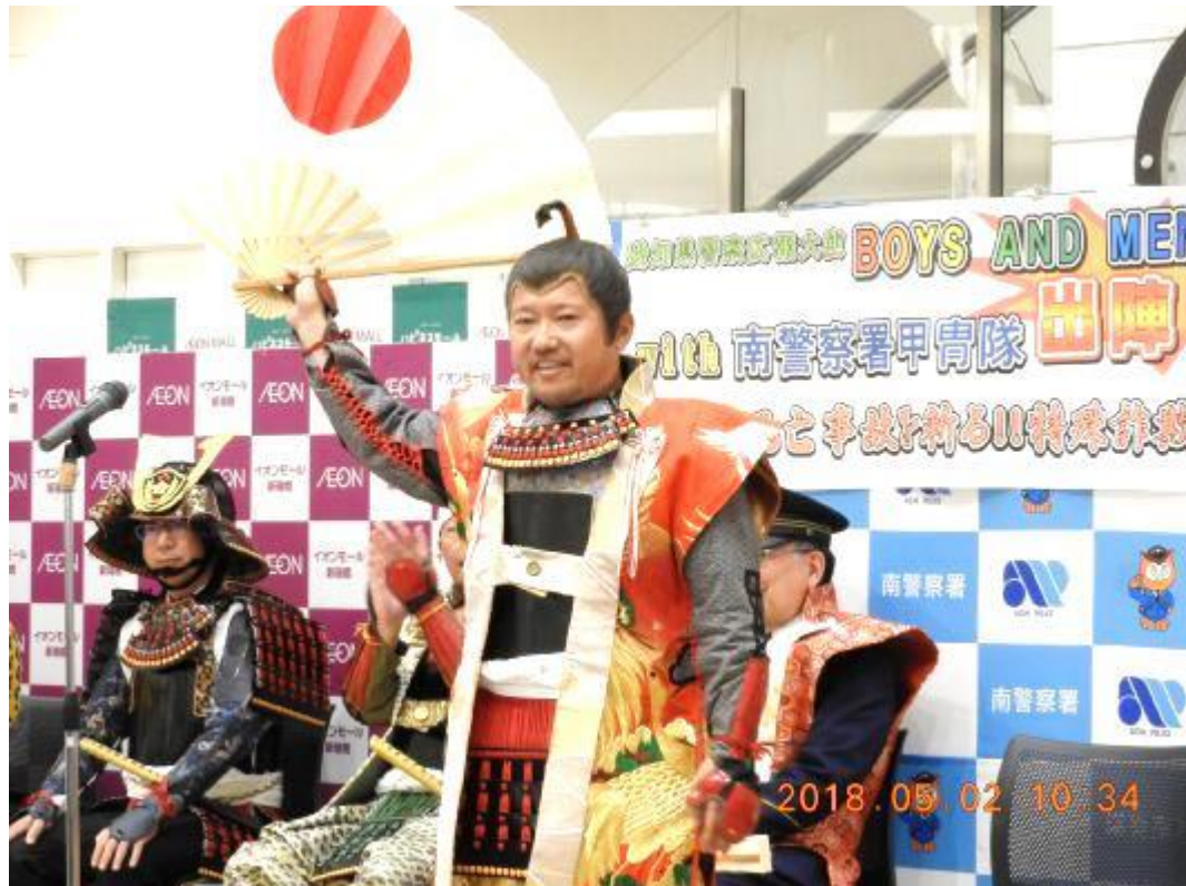
持留大將は来賓として参加