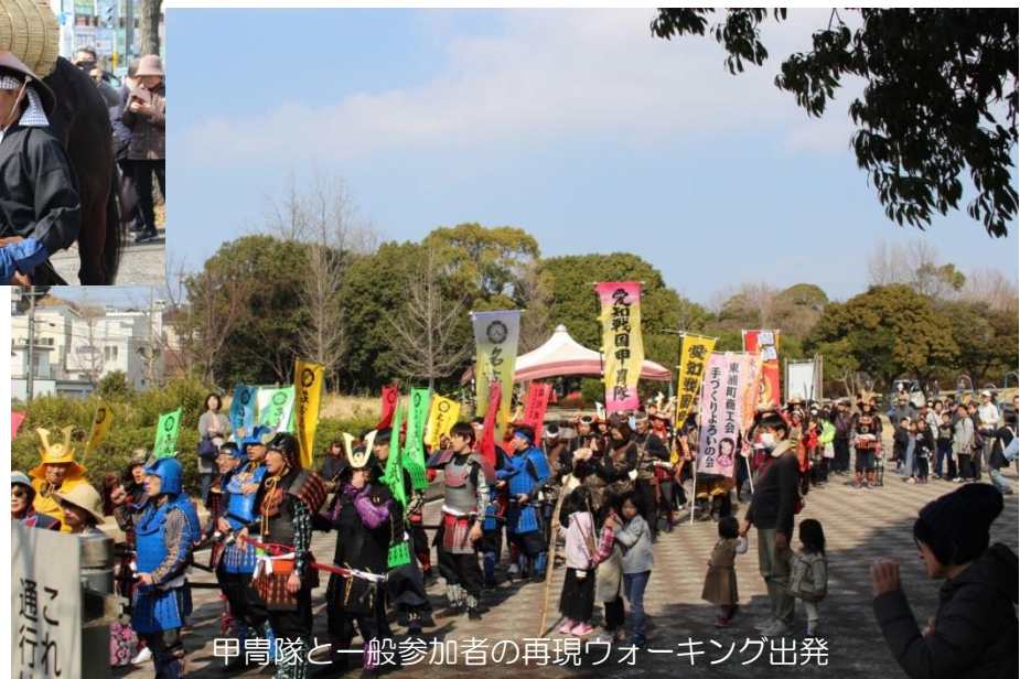
甲冑隊と一般参加者の再現ウォーキング出発