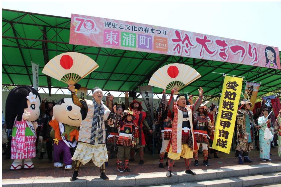
ステージでの甲冑隊紹介