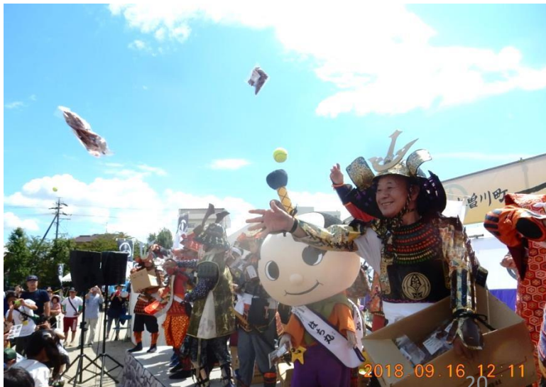
大観衆を前にかりんとう投げを行った