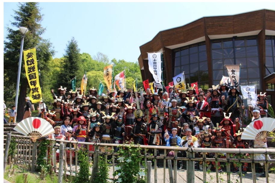
愛知戦国甲冑隊揃い踏み