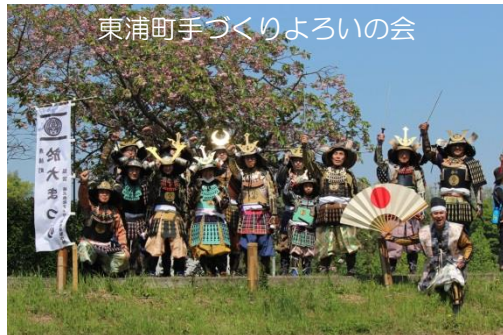
東浦町手づくりよろいの会