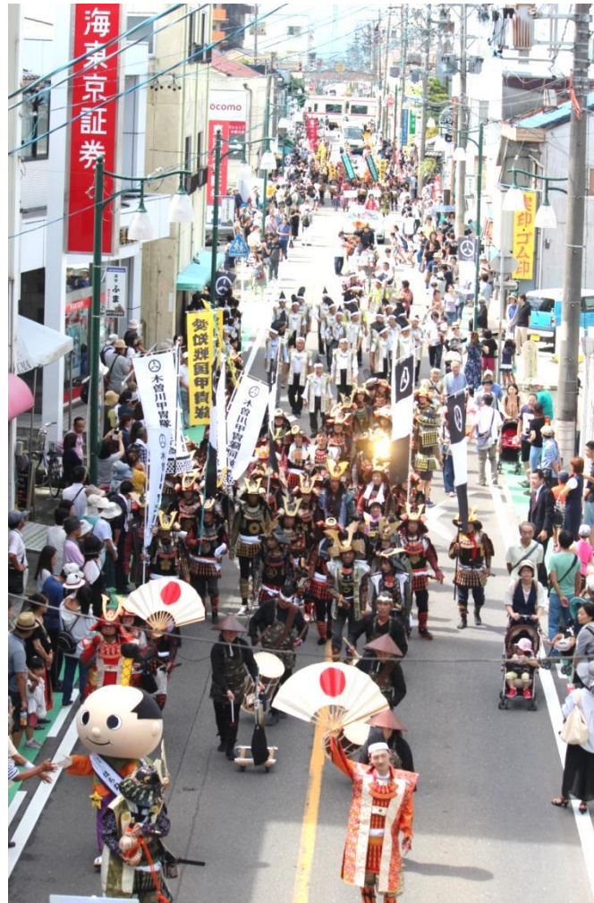
先陣を切り、愛知戦国甲冑隊の勇姿→