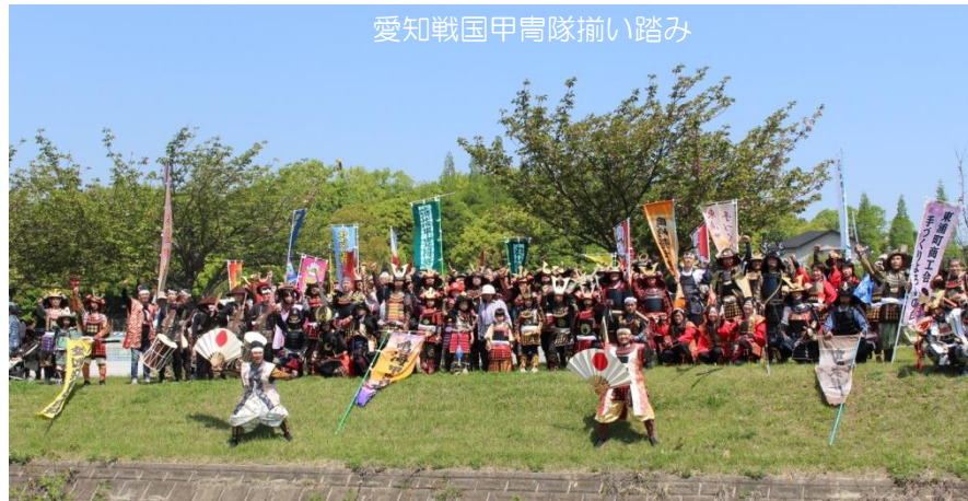
愛知戦国甲冑隊揃い踏み