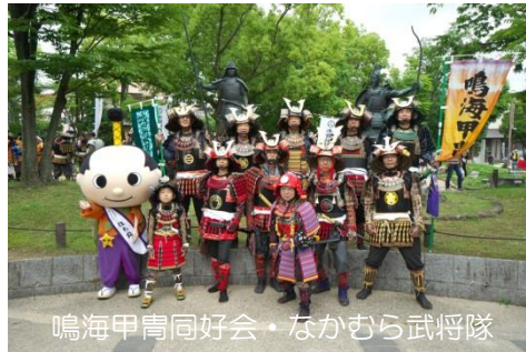
鳴海甲冑同好会・なかむら武将隊