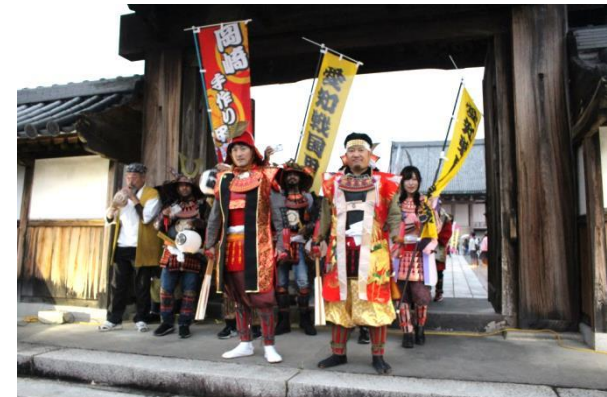
三河別院から出陣