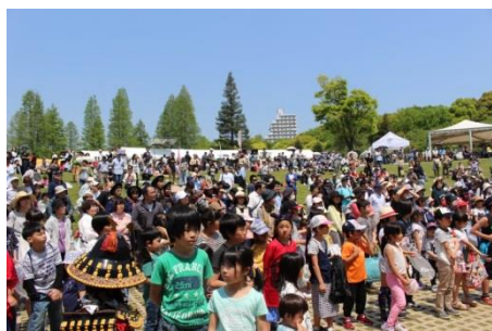
大勢の人が、かりんとう投げに集まった