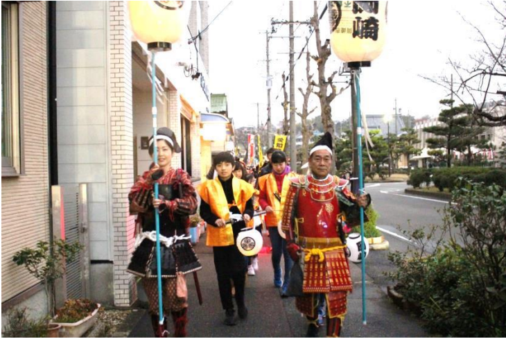
岡崎隊の高張提灯で先陣を務める