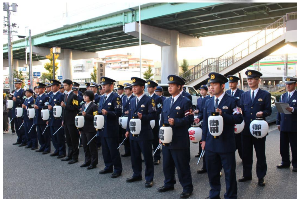
御用提灯と十手を持ち式典にのぞむ南署員