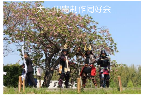
大山甲冑制作同好会