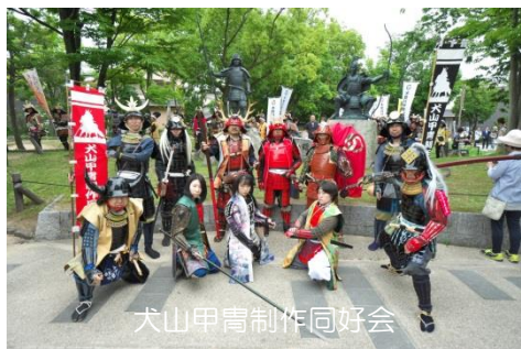
犬山甲冑制作同好会