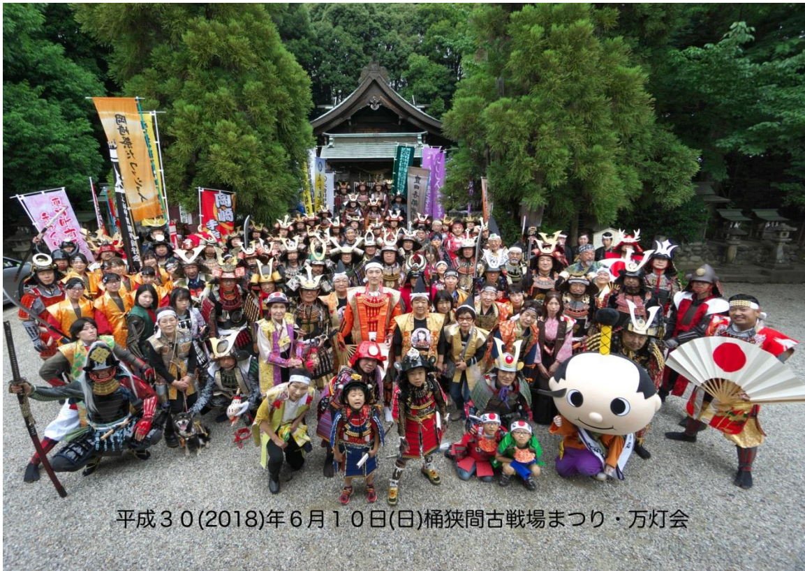
平成30(2018)年6月10日(日)桶狭間古戦場まつり・万灯会