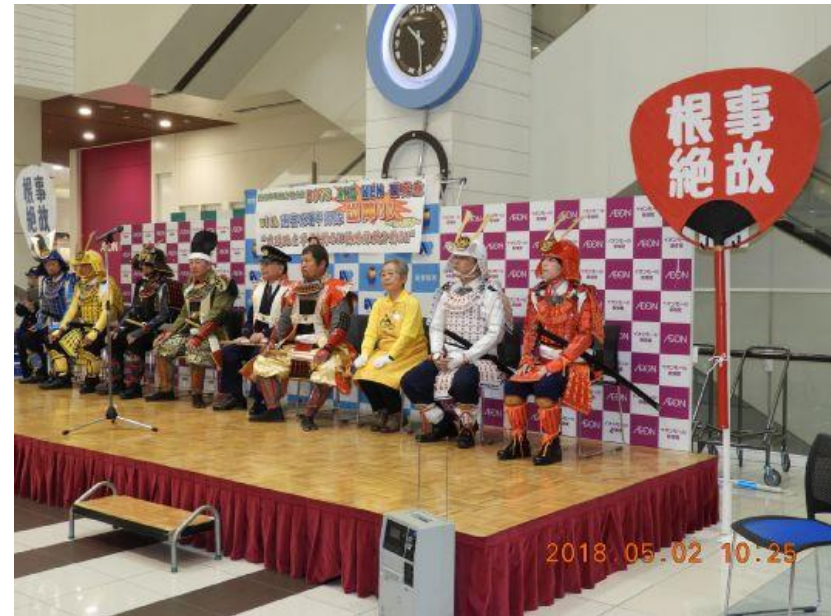
南警察署甲冑隊揃い踏み