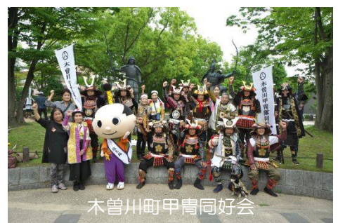
木曾川町甲冑同好会