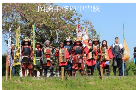
岡崎手作り甲冑隊