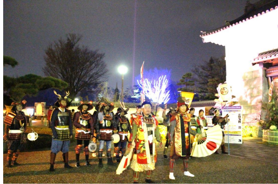
岡崎城正門前でお出迎えする愛知戦国甲冑隊