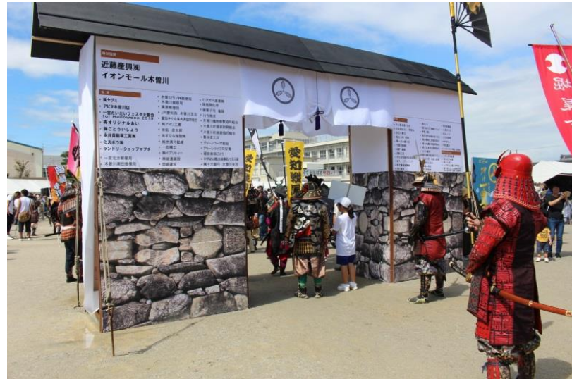
黒田小学校の城門に到着