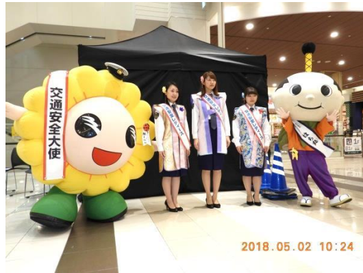
3名の交通安全レディース