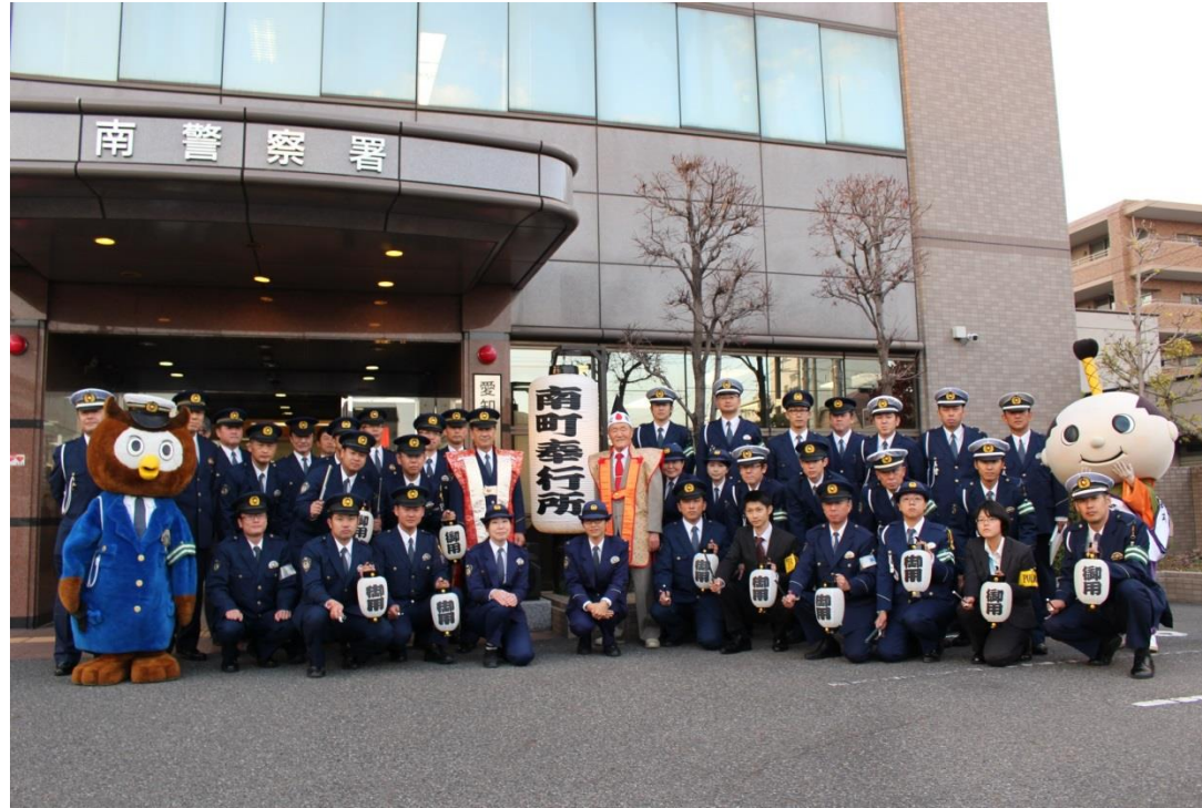
南警察署員揃い踏み