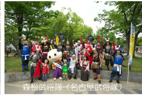
森松武将隊（名古屋武将隊）