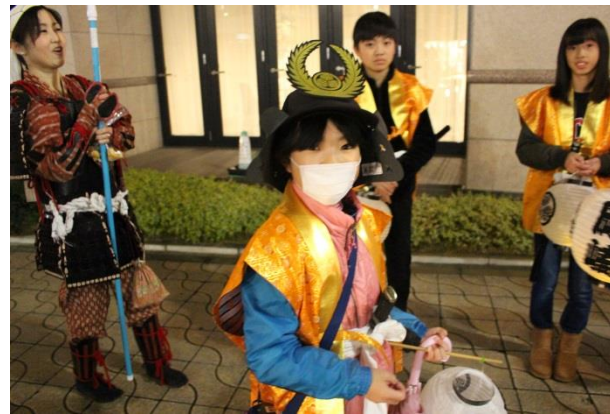
提灯行列先導隊は、岡崎隊の女子たちが務めた