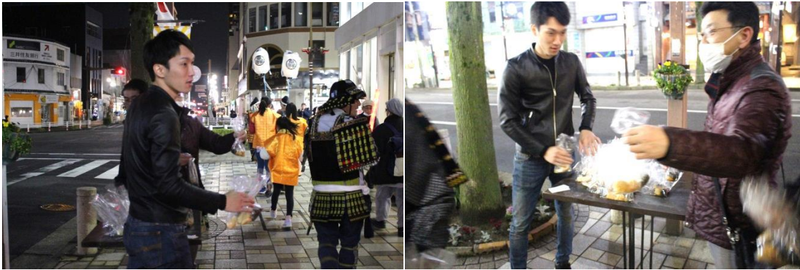
和菓子店「旭軒元直」さんから、お祝い餅のおもてなしを受けた