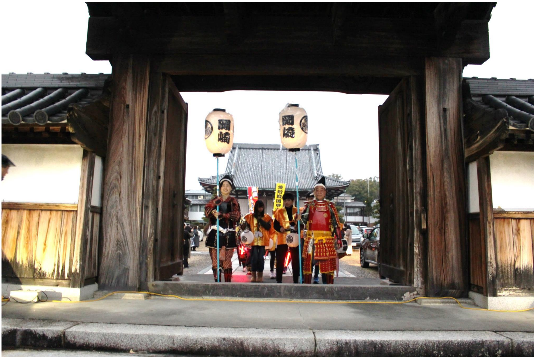
提灯行列の先導役は、岡崎隊の選抜隊が務めた