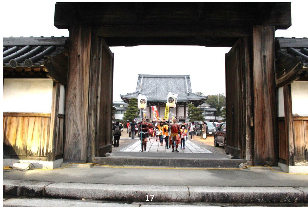
三河別院大門より出立