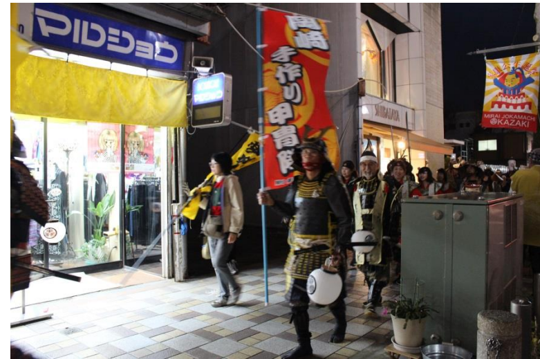
マルショウ(店舗)へ、必勝勝ち鬨を挙げた